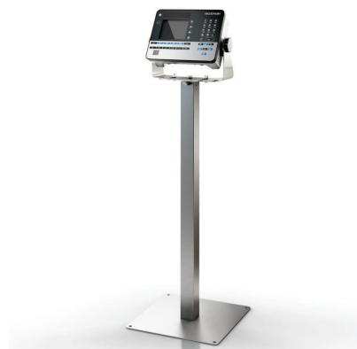
Terminal de pesée iS30 avec colonne

Grâce à son large écran graphique, l'opérateur voit tous les informations importantes en un coup d'œil. Les données produit peuvent être rapidement visualisées et éditées. Les grandes touches fonctionnent même avec des gants. Un signal sonore confirme une entrée. L'électronique puissante du terminal, et ses différents interfaces permettent des intégration aisées dans les applications informatique client. Jusqu'à deux modules de pesée peuvent être connectés pour plus de flexibilité.