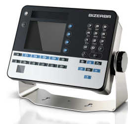
Terminal de pesée iS30